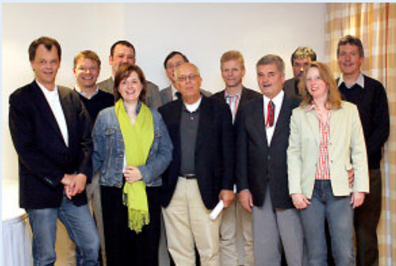
Teilnehmer der Task-Force-Sitzung in Potsdam

grenzte derart die erfolglos finanzierten WEB-Anwendungen der Jahre vor 2001 von denen ab, die inzwischen zu einem großen Erfolg geführt haben. In diesem WEB-2 steht nach Analyse von Krefte weiterhin die menschliche Kommunikation, Information im Vordergrund, wie es auch schon bei Katalogbestellungen, Lexika oder Atlanten bisher gegeben war. All diese WEB-Anwendungen sind nach Krefte dadurch charakterisiert, dass "Im WEB-2 der Mensch bleibt, wie er ist".